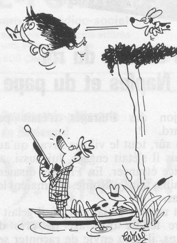
- Toi, à force de boire, tu finiras par voir des éléphants volants... (Dessin de Hervé-Cosmopress)