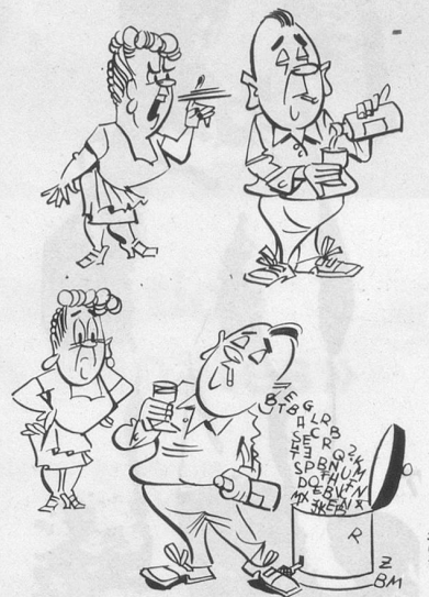
Sans paroles (Dessin de Rufa-Cosmopress)