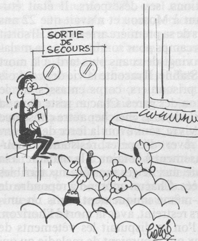
— C'est la place préférée de l'auteur!... (Dessin de Hervé-Cosmopress)