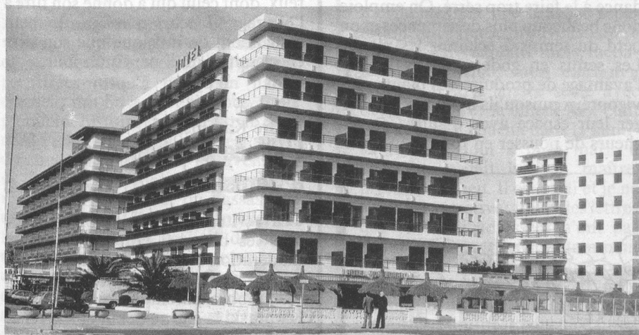
Hôtel Monte-Carlo - Rosas

Un conseil: s'inscrire à temps, la demande étant forte pour Rosas! Inscriptions à «Aînés», case postale 2633, 1003 Lausanne. Tél. 021/22 34 29.