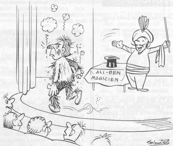
Y a-t-il un autre volontaire pour la démonstration? (Dessin de R. Sabatès)