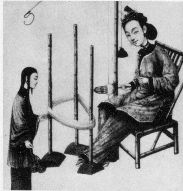
C'ÉTAIENT DE DRÔLES DE TYPES