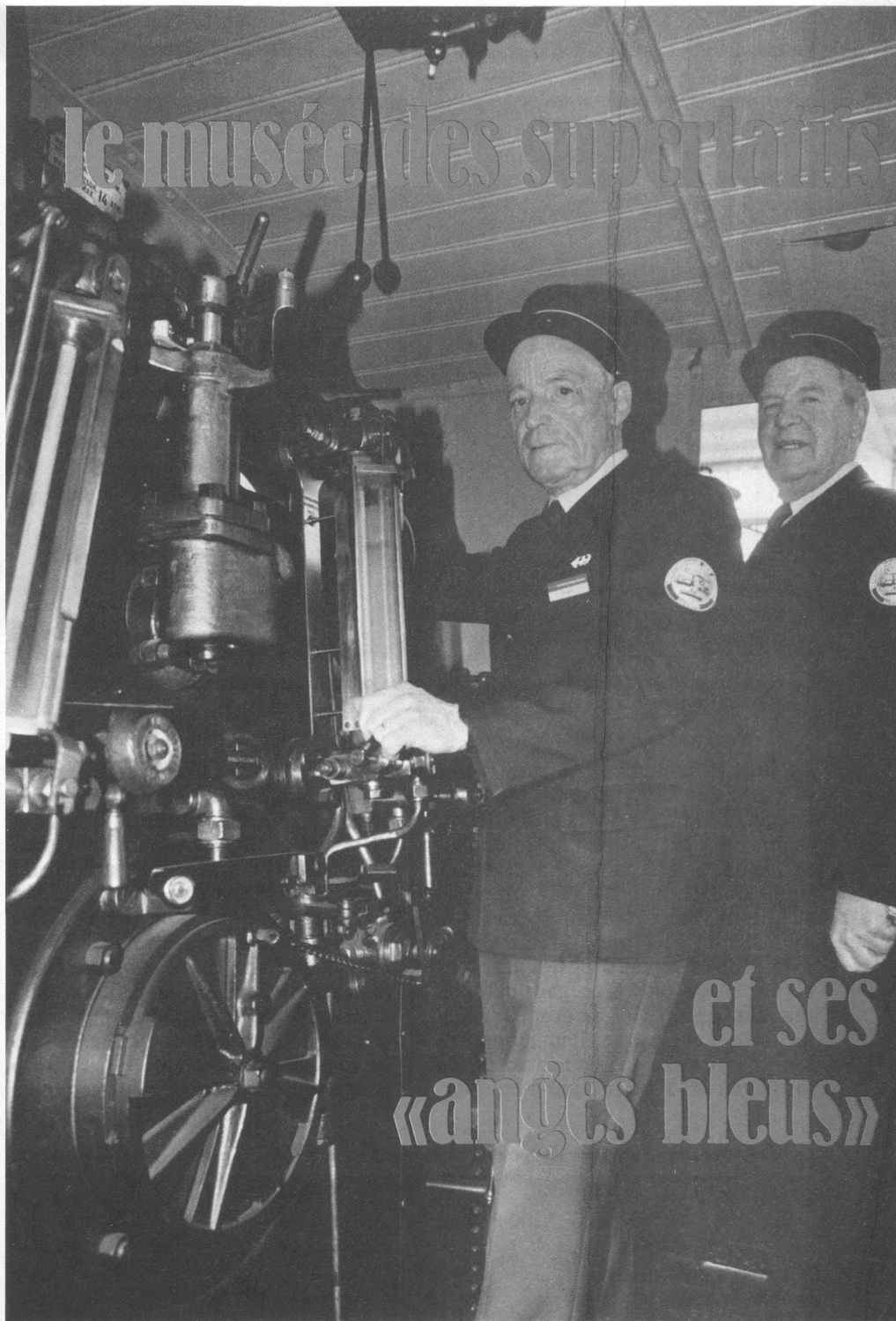
Prêt à fonctionner, comme tout ce qui est exposé. Ici une loco mixte à adhérence et à crémaillère pour ligne de montagne. Ligne du Brünig, CFF 1909.

Tout cela, de la loco à vapeur au Coronado, en passant par les tramways (à cheval ou électriques), cars, téléphériques, vapeurs, maquettes... représente une richesse difficilement calculable. Dans la foule des visiteurs se cachent