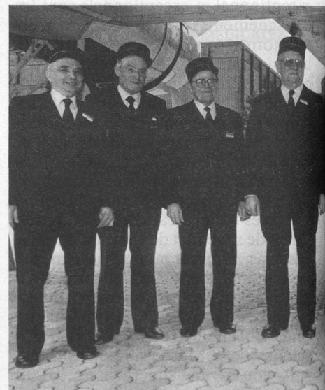
Huit parmi 48! Tous retraités, tous devenus...

Revenons-en à nos vaillants retraités. Que pensent-ils de la mission qui leur est confiée? Comment, pourquoi ont-ils accepté ce travail payé à l'heure et qui occupe une partie de leurs loisirs forcés?