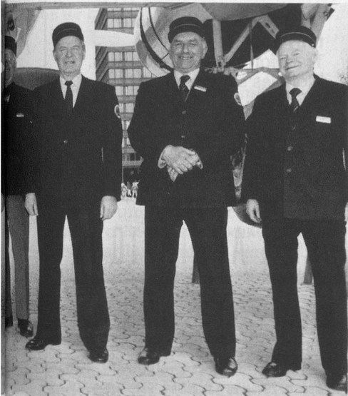
spécialistes. Sous une aile du Coronado.

Répondre aux questions qui me sont posées me donne la certitude de continuer à jouer un rôle dans la société...»