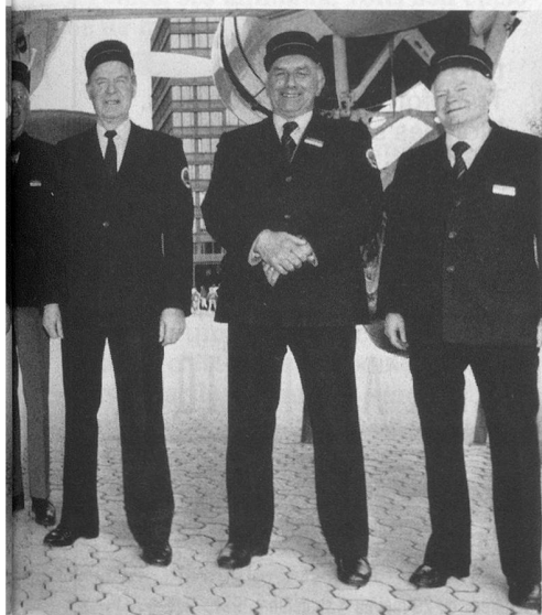
spécialistes. Sous une aile du Coronado.

Répondre aux questions qui me sont posées me donne la certitude de continuer à jouer un rôle dans la société...»