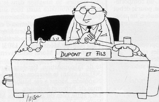
Sans paroles (Dessin de Moser-Cosmopress)