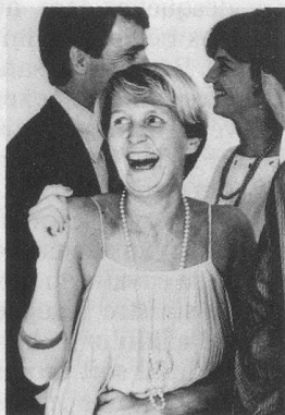
En Suisse, plus de 200 000 femmes et hommes souffrent, à des degrés divers, d'incontinence d'urine.

Beaucoup de personnes voudraient mais n'arrivent pas à maîtriser les problèmes d'hygiène que leur pose l'incontinence d'urine.