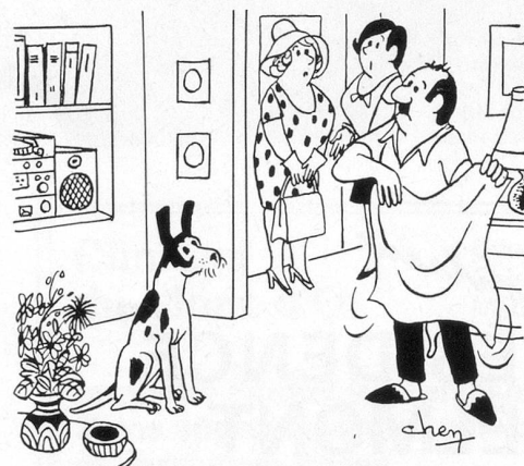
...Nous avons passé nos vacances en Espagne!... Dessin de Chen (Cosmopress Genève)