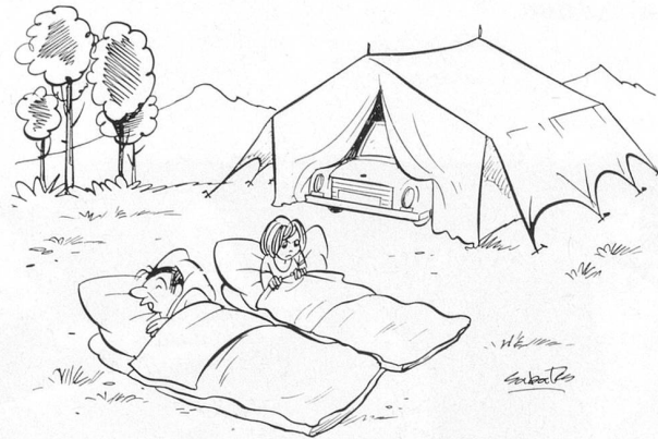
Sans paroles. Dessin de Ramon Sabatès

Ne pas utiliser ce coupon pour le renouvellement de l'abonnement svp.