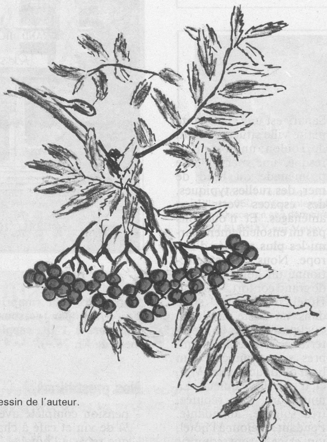
Dessin de l'auteur.