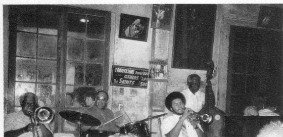
L'orchestre en début de soirée. L'ambiance s'installe.