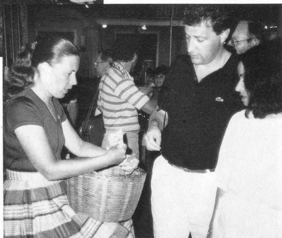
La caissière est mignonne, sa caisse sur les genoux.