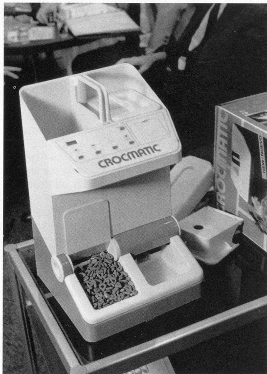
Le «Crocmatic» pratique pour propriétaires de chats ou de chiens devant s'absenter. Repas servis à heures précises.