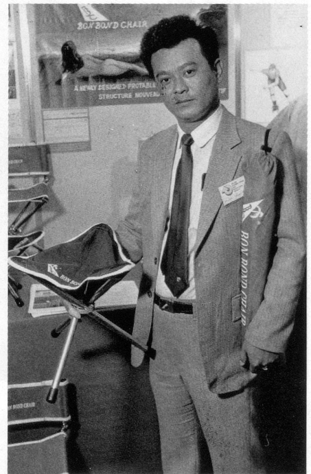
Ça se porte à l'épaule. Un parapluie? Mieux que ça: un siège pour longues randonnées.

pos en transformant une sorte de canne en une mignonne petite chaise-pliant. Le tout portable à l'épaule. Et comme j'aime les animaux, j'ai craqué, ému, devant une veste-aquarium en plastique transparent permettant de promener ses poissons rouges tout en ne passant pas inaperçu.