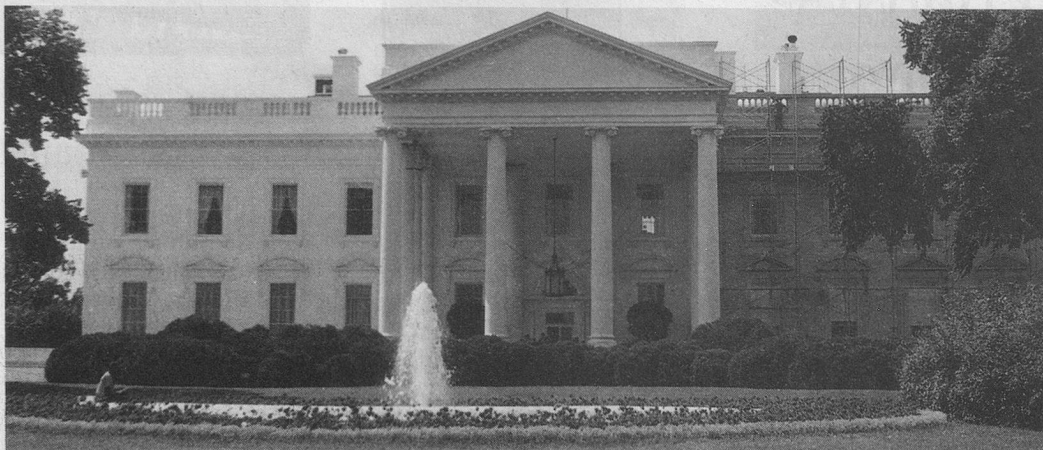
Un prestigieux bâtiment: la Maison-Blanche.