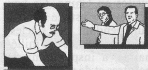
Arthrose, arthrite, rhumatisme, douleurs dans les épaules et la nuque, douleurs musculaires.

prolongé, il représente la possibilité de diminuer l'emploi et la quantité de médicaments qui, dans certains cas, deviennent difficiles à supporter.