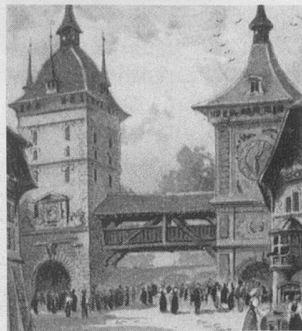
Exposition universelle de Paris. L'entrée du Village suisse.

Dès janvier, un numéro d'ordre bien apparent dut désormais figurer sur les automobiles, afin de permettre aux agents de la circulation de verbaliser contre les chauffeurs trop pressés.