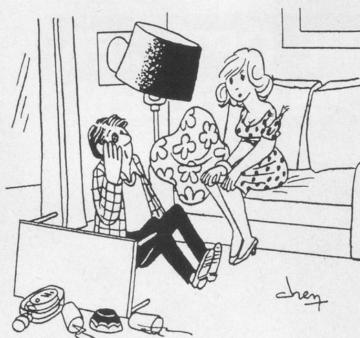
— Pour une fois que j'essaie de me libérer de mon complexe de timidité... Dessin de Chen, Cosmopress, Genève.