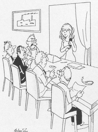
— Qui d'entre vous est le «Petit Poucet en sucre rose»? Dessin de Ramon Sabatès.

Ne pas utiliser ce coupon pour le renouvellement de l'abonnement svp.