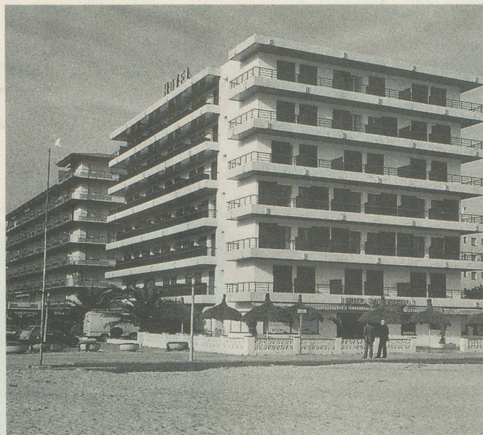
L'Hôtel Monte-Carlo à Rosas.

Pour plus de détails, voir notre reportage dans «Aînés» N° 6 de juin. Un programme détaillé est à disposition à Wagons-Lits Tourisme, Gare CFF, 1003 Lausanne, tél. 021/20 72 08. Le paradis des Embiez vous attend!