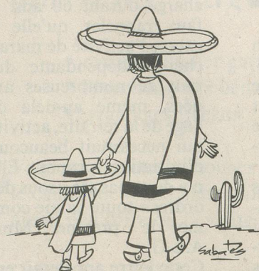
Sans paroles. Dessin de Ramon Sabatès.