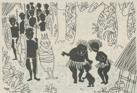
L'anniversaire. Dessin de Leho, Cosmopress Genève.