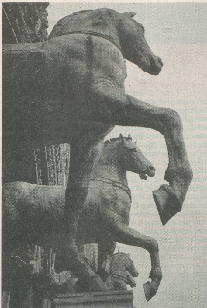
Les célèbres chevaux de bronze sur la place Saint-Marc à Venise.