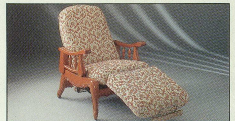
Everstyl « Elysée » fauteuil rustique

Notre catalogue gratuit vous présente un grand choix de modèles (rustique, contemporain, style) et de revêtements : velours, très beau cuir et cuir de synthèse. Finition « décoration », robuste à toute épreuve : Everstyl est bâti pour défier le temps... Profitez de son prix « vente directe usine », dans toute l'Europe, sans intermédiaire.