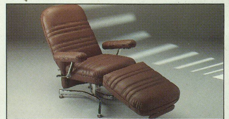
Everstyl « Trocadéro » ligne mode contemporaine