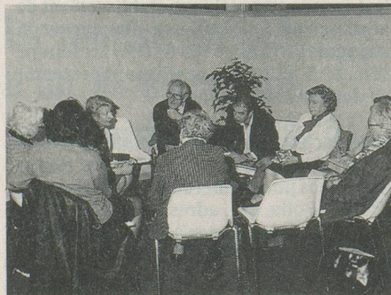
Un voyage riche en échanges