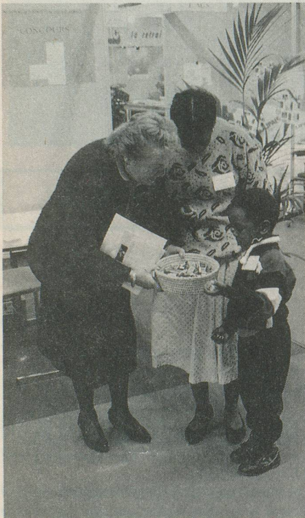
Le chocolat suisse, un moyen de nouer le dialogue