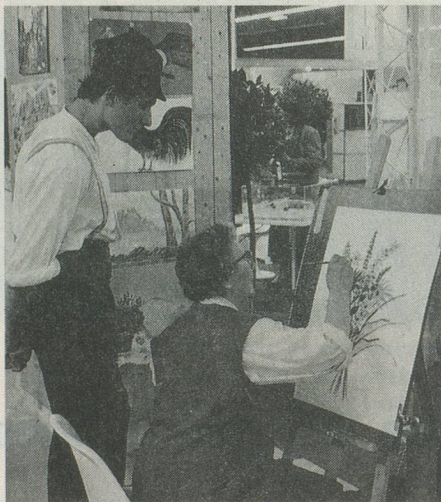
La créativité, source d'admiration