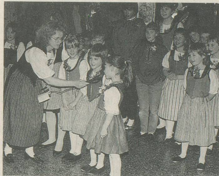
Même les fillettes du groupe folklorique y vont d'une histoire drôle racontée dans un savoureux patois.

deux langues et presque toujours gratuites.