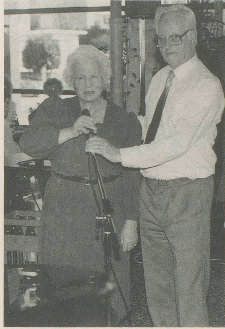
C'est l'heure du tour de chant: un pathétique «Etoile des neiges...»

C'est en 1974 déjà que Pro Senectute donnait le coup d'envoi d'un «Club de Midi» à Bienne, qui devait réunir chaque semaine une moyenne de 50 personnes. Quatre ans plus tard, l'idée vint de créer un cercle de rencontre analogue le dimanche, une journée peu animée pour les personnes âgées, car les rues de la ville sont désertes et bon nombre d'établissements publics fermés. 90 personnes répondent à une première invitation le 1 er février 1980. Actuellement, la fréquentation moyenne dépasse 120 personnes 15 dimanches par année pour atteindre 150 lors des fêtes. L'Ecole professionnelle met sa cafétéria gratuitement à la disposition du club, et le chef de cuisine officie aux fourneaux. Une équipe de trois personnes prend à tour de rôle la responsabilité de l'organisation. Quant aux volontaires, de douze à quinze suivant le nombre de convives, ils assurent les achats, la caisse, le service de taxi, l'office, le service de table, le nettoyage ainsi que les activités de loisirs (théâtre, projections, jeux, etc.) le plus souvent dans les