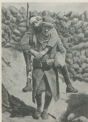
Les héroïques poilus dans leurs tranchées.

des Anglais de vaincre est inébranlable. Rappelons qu'au début de l'année, l'Allemagne, redoutant l'entrée en guerre des Etats-Unis, propose au... Mexique une alliance assortie de séduisantes promesses. Début avril, le tsar et sa famille sont arrêtés; ils ne seront pas épargnés. En Grèce, le roi Constantin abdique, permettant à Venizelos de revenir au pouvoir, ce qu'il fait en déclarant la guerre aux Allemands... En Russie, le vertige se prolonge. Elu par 20 millions de paysans, ouvriers et soldats, le 1 er Congrès des Soviets ne voit la victoire que d'une centaine de bolcheviks sur mille délégués. Kamenev et Trotski sont arrêtés et Lénine se réfugie en Finlande à la veille de la proclamation de l'indépendance de ce pays. Lénine revient bientôt secrètement à Petrograd, et en novembre, le 2 e Congrès des Soviets annonce que désormais les bolcheviks gouvernent, ceci au lendemain de l'assaut du Palais d'Hiver. A 76 ans, Georges Clemenceau, dit «Le Tigre», est porté au pouvoir à Paris; son nom restera pour toujours attaché aux prouesses de l'armée française. Que d'événements! Mais tout se précipitera dans quelques mois: la paix s'annoncera enfin, en