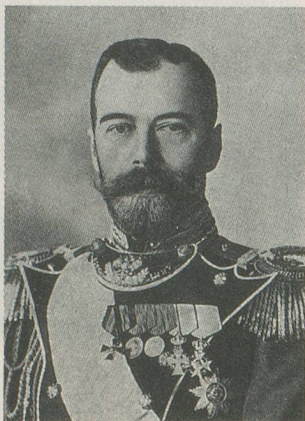
De Nicolas II qui abdique...

Philosophe et homme politique savoyard, Joseph de Maistre (1753-1821), adversaire passionné de la Révolution française, fut un adepte de l'idée d'une unité providentielle du monde, ce qui lui inspira de fort beaux textes. Celui-ci par exemple: «Ainsi s'accomplit sans cesse, depuis le ciron jusqu'à l'homme, la grande loi de la destruction des êtres vivants. La terre entière, continuellement imbibée de sang, n'est qu'un autel immense où tout ce qui vit doit être immolé sans fin, sans mesure, sans relâche, jusqu'à la consommation des choses, jusqu'à l'extinction du mal, jusqu'à la mort de la mort.» A cette envolée philosophique, la guerre qui se poursuit donne un relief particulier.