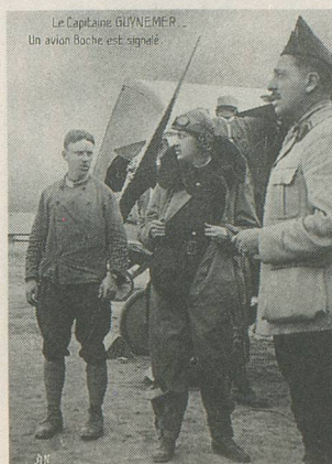
Le capitaine Guynemer a signé 53 victoires.

De grandes voix se sont tues, de superbes talents se sont éteints, des héros sont entrés dans la légende. Guynemer, par exemple, mort le 11 septembre au combat. Engagé dans l'aviation à 20 ans, en 1914, ses 53 victoires lui