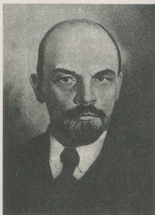
...à Lénine qui tromphe.

Quatrième année de la Première Guerre mondiale qui laboure l'Europe avec une intensité que l'intervention des Etats-Unis va encore aiguïser... Ce fut l'année charnière. Sans doute conscient de cette réalité, Guillaume II décide de mener une guerre sous-marine à outrance. En avril seulement, 875 000 tonnes de navires alliés sont envoyées par le fond.