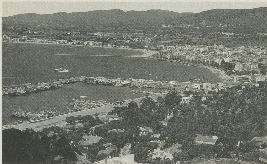
Rosas et son golfe bien abrité.