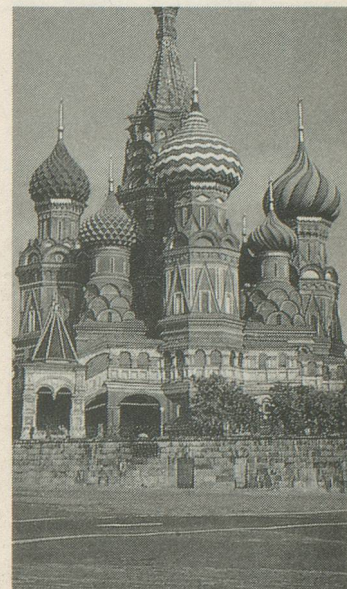
La cathédrale Saint-Basile, à Moscou.

Prix par personne: Fr. 1530.- tout compris (chambre 1 lit supplément Fr. 230.-). ■