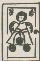
Carte de vœux