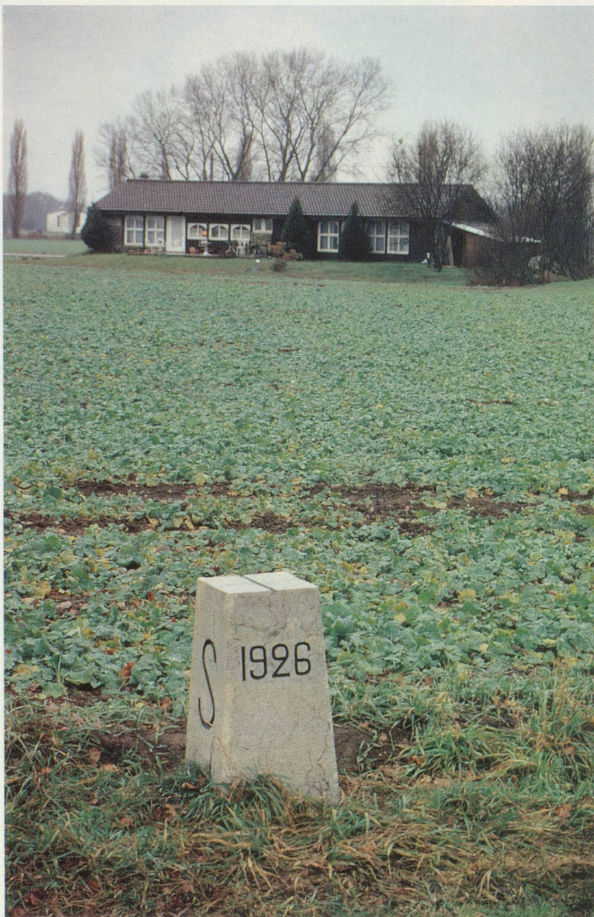
A quelques mètres de la frontière suisse, un pavillon scolaire est devenu une somptueuse villa.