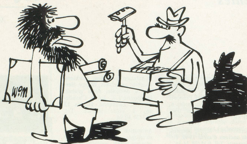
Sans paroles. Dessin Moese, Cosmopress Genève

Ne pas utiliser ce coupon pour le renouvellement de l'abonnement.