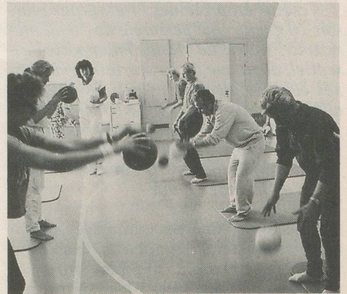
Les cours de l'Ecole du dos de la Ligue suisse contre le rhumatisme se déroulent en petits groupes sous la direction d'un physiothérapeute. Les participants y apprennent à adopter des postures correctes pour tous les gestes de la vie quotidienne.

Les connaissances bio-mécaniques et physio-pathologiques actuelles permettent d'incriminer dans une bonne partie des cas un vice postural, dynamique ou statique, provoquant ou entretenant cette douleur, expliquant ainsi les alternances de récurrence et d'amélioration chez un patient donné. Souvent, ce problème se double d'une pathologie psychiatrique, celle-ci n'entrant de toute évidence pas dans le cadre thérapeutique de l'Ecole du dos. Il faudra distinguer l'épisode aigu, s'accompagnant ou non d'une complication neurologique et qui justifiera un traitement médical ou chirurgical, du