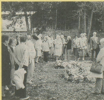
Il n'y a pas de torrée sans feu...