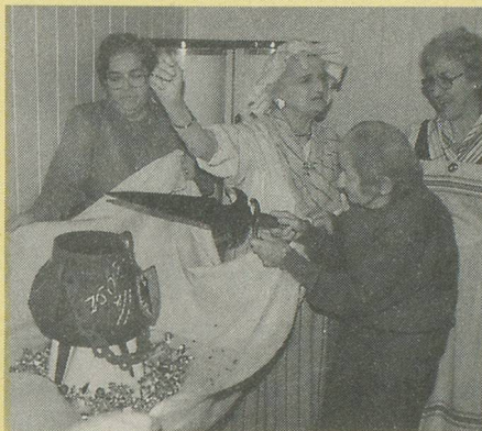
La marmite de l'escalade.

L'échange de ces traditions a rencontré un vif succès, cela nous a donc encouragés à récidiver et nous prévoyons d'aller à la découverte d'autres traditions qui se traduisent par une manifestation ou une fête!