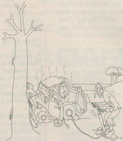
Sans paroles. Dessin de Biret, Cosmopresses Genève.