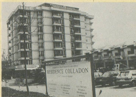
La Résidence Colladon