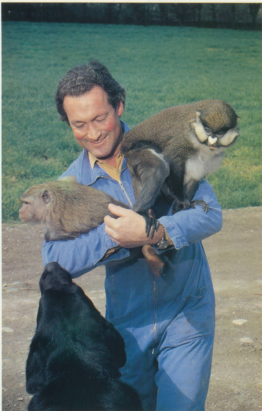
Copain-copain avec tout le monde, et même avec les singes de la maison...