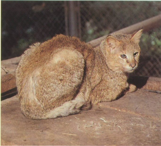
Le chat des Marais, un véritable chat sauvage.