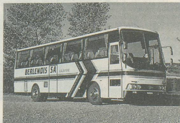
Le car qui vous emmènera sur les hauteurs de la station

Pour vous inscrire: Voyages Berlendis, avenue de la Gare 6, 1003 Lausanne, tél. 021/20 50 45. Mentionnez le voyage d'Aînés à Ovronnaz, tout en précisant votre lieu de domicile. A bientôt sur les hauteurs valaisannes!