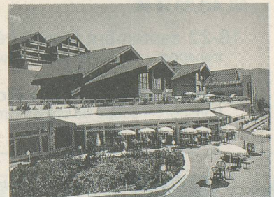
Le centre thermal d'Ovronnaz

Pour vous inscrire: Voyages Berlendis, avenue de la Gare 6, 1003 Lausanne, tél. 021/20 50 45. Mentionnez le voyage d'Aînés à Ovronnaz, tout en précisant votre lieu de domicile. A bientôt sur les hauteurs valaisannes!