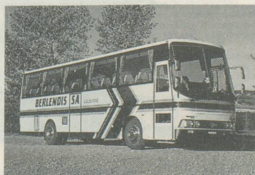
Le car qui vous emmènera sur les hauteurs de la station

Pour vous inscrire: Voyages Berlendis, avenue de la Gare 6, 1003 Lausanne, tél. 021/20 50 45. Mentionnez le voyage d'Aînés à Ovronnaz, tout en précisant votre lieu de domicile. A bientôt sur les hauteurs valaisannes!