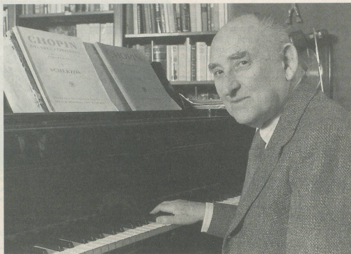
Nikita Magaloff

La marque de disques «Philips» ne pouvait apporter meilleure contribution à la célébration du 80 e anniversaire du pianiste russe Nikita Magaloff qu'en éditant un seul coffret de treize disques compact, l'intégralité des enregistrements de la musique pour piano de Frédéric Chopin, dont cet artiste demeure, depuis le début de sa carrière, l'interprète privilégié.