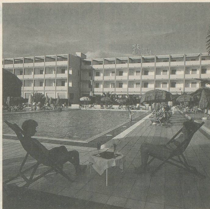
L'Hôtel Oasis et sa grande piscine, à Fertilia-Alghero.