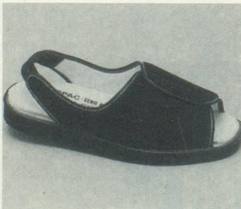
FORMEN N°1 Marine Fr. 77.-

(Veuillez indiquer le nombre de paires dans les cases correspondantes, s.v.pl.)