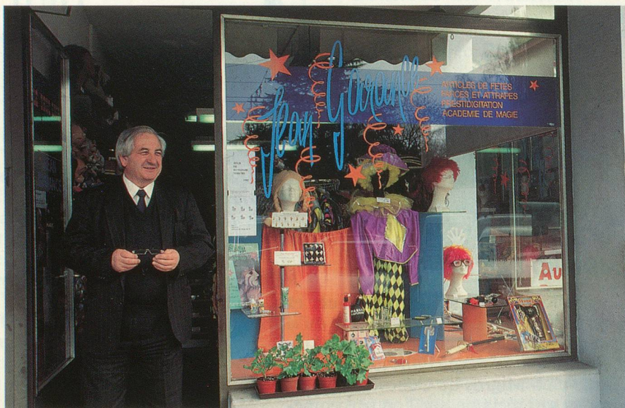
Une boutique, beaucoup de surprises: le Truc'Store.