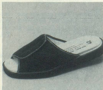
FORMEN N°2 Marine Fr. 73.-