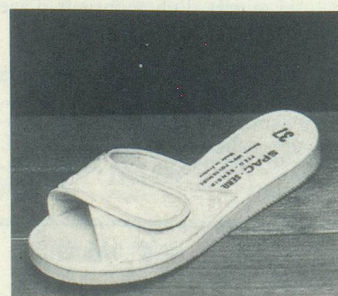
STAR N°2 Blanc Fr. 66.-