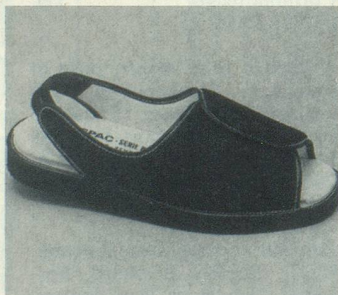
FORMEN N°1 Marine Fr. 77.-

(Veuillez indiquer le nombre de paires dans les cases correspondantes, s.v.pl.)