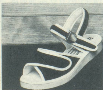
STAR N°1 Marine Fr. 71.-