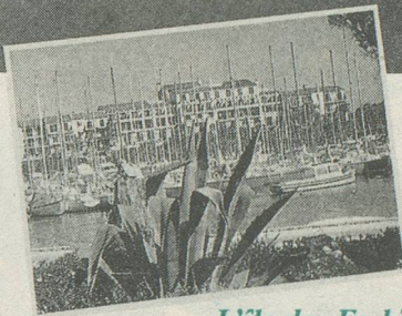
L'île des Embiez