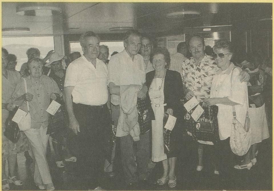
Les gagnants de la journée quelques instants avant de débarquer du bateau.

Renseignements et inscriptions au 021/36 17 21. Dès le 13 septembre, 021/646 17 21.