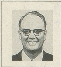
Robert S. Ford

Selon une récente découverte diététique américaine