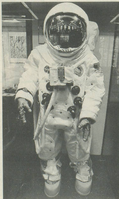
La combinaison lunaire portée par les astronautes américains du programme Apollo de 1969 à 1972.