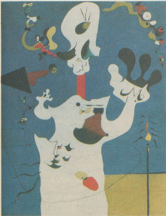
Joan Miró: «Pomme de Terre», 1928. Huile sur toile (101 x 81,7)

l'œuvre étrange et torturée créée à l'automne de sa vie (Cavalier et Femme nue, 1967).