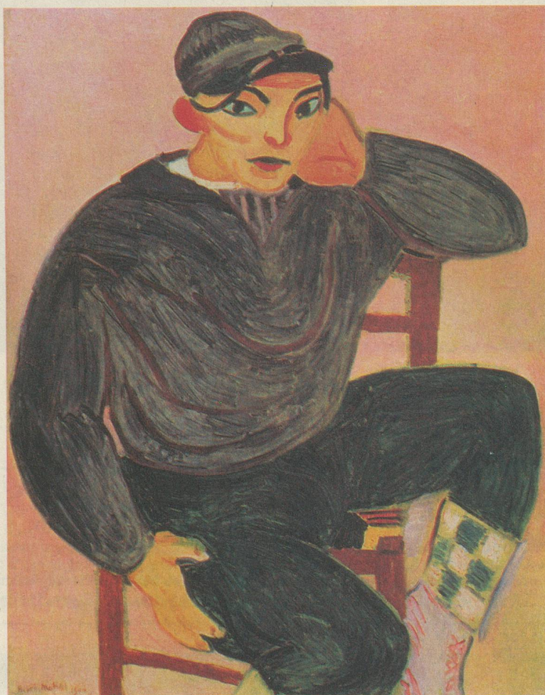
Henri Matisse: «Le jeune Marin», 1906. Huile sur toile (101,5 x 83)

Jusqu'au 1 er novembre prochain, la Fondation Pierre Gianadda propose une rétrospective prestigieuse. Quarante-vingts œuvres, parmi lesquelles des dessins, des peintures et des sculptures, appartenant à la collection Jacques et Natasha Gelman. Cette collection exceptionnelle a été exposée pour la première fois en 1989 au Metropolitan Museum of Art de New York.