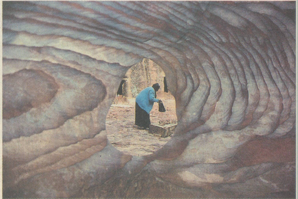
La mystérieuse passante de Pétra.

La Jordanie d'aujourd'hui a pris naissance, officiellement, le 24 avril 1949, lorsque l'émir Abdallah (le grand-père du roi Hussein) s'en est fait proclamé le roi. Au début de cette même année, il avait annexé la Cisjordanie, cette région occidentale du Jourdain, formée de la Samarie et d'une partie de la Judée, que les Israéliens ont occupée en 1967.