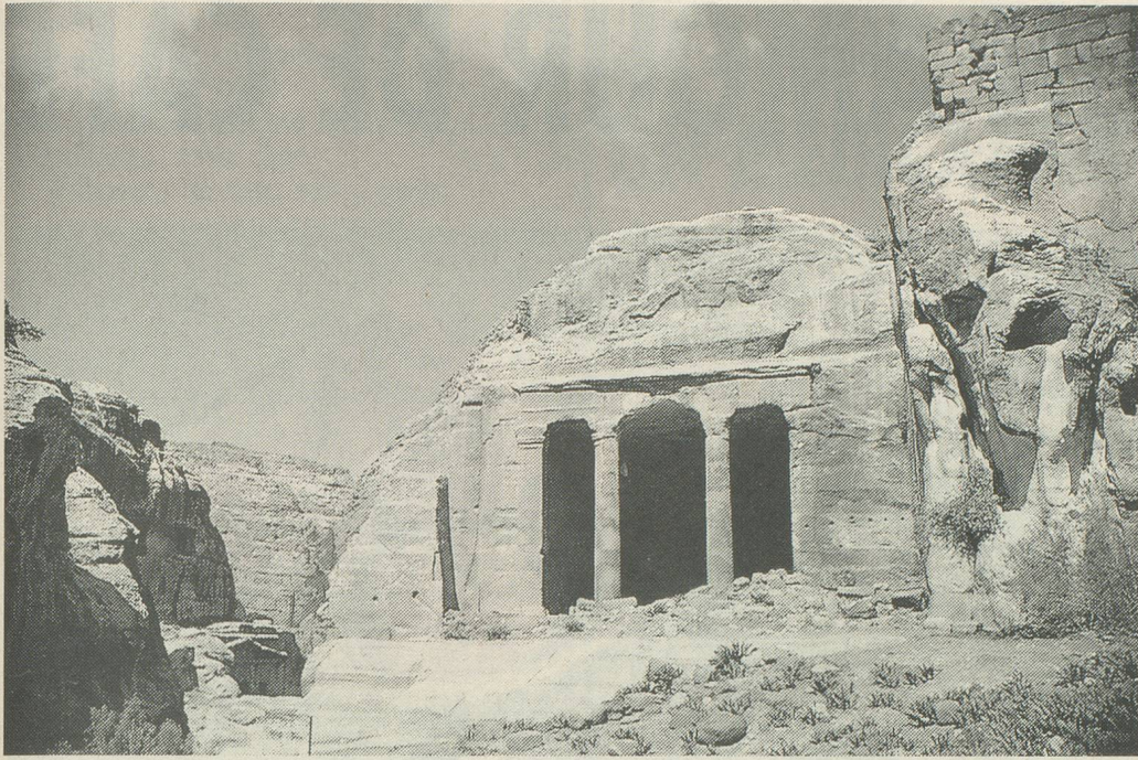
Le Qsar Hamra, château du désert construit au 8 e siècle.

deux obélisques hauts de six à sept mètres, une place de sacrifices d'où l'on a vue sur le Mont Hor, couronné d'un petit dôme blanc qui marque l'emplacement présumé du tombeau d'Aaron, le frère de Moïse, constituent un extraordinaire défi lancé à la nature, mais aussi un défi de la vie jeté à la face de la mort.