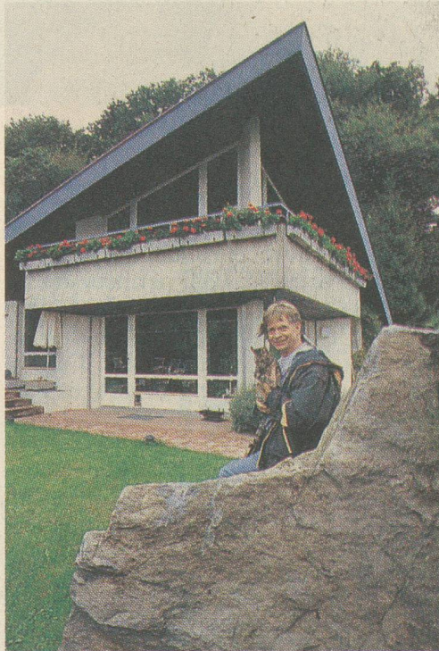
Sa maison-berlingot en pleine nature

- Elles étaient très fortes, parce que, par hasard, juste à ce moment-là, j'arrivais à une certaine maturité dans ma vie privée et professionnelle et j'aspirais à faire autre chose que des émissions légères. J'avais même imaginé m'inscrire à la