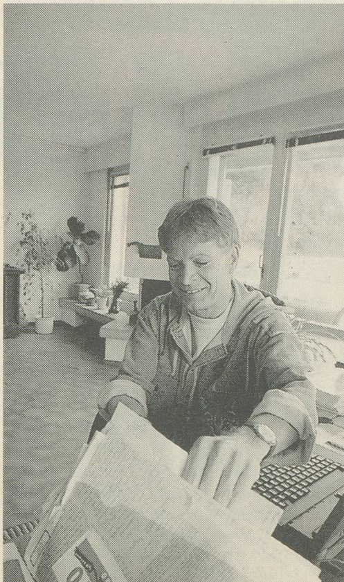
Un courrier considérable...