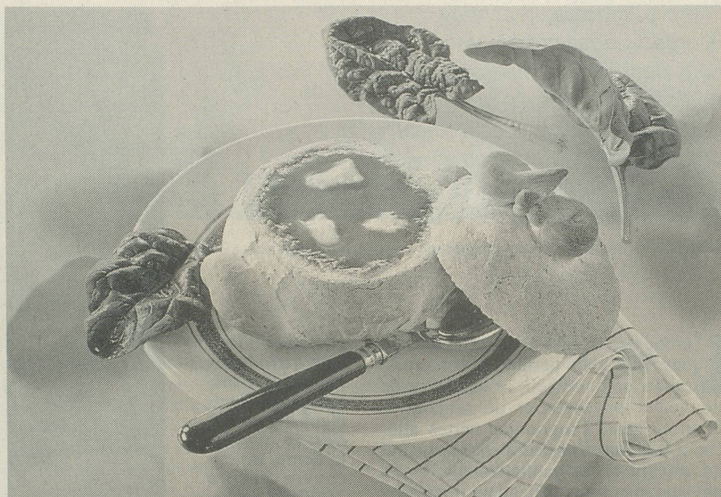
Soupe servie dans une tasse à potage.

Chaque potage a son caractère: légumes frais de saison, légumes secs colorés tels que lentilles, haricots ou pois, ainsi que maïs, orge ou pâtes confèrent à la potée couleur, goût et texture. Des morceaux maigres de viande, de poisson ou de volaille, ou encore des petites quenelles, corsent son goût et sa consistance. Il est connu que l'on mange avec les yeux. Un potage servi dans des tasses «faites maison» apporte une note originale à une soirée entre amis.