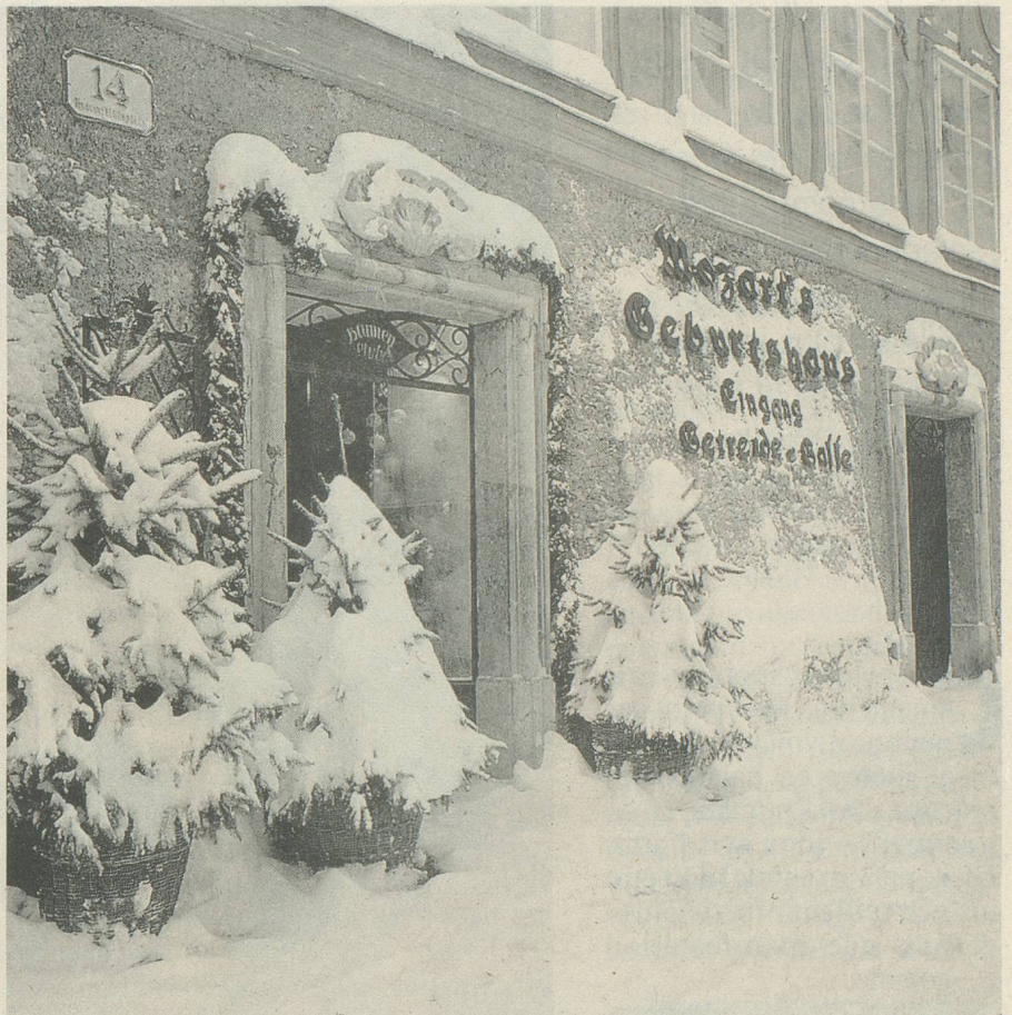
L'entrée de la maison où vécut Mozart dans ses premières années.

Même si, durant l'hiver, les pèlerins-touristes sont moins nombreux, la ville ne s'assoupit jamais. On prétend même que l'atmosphère hivernale est plus «gemütlich». A tel point que la période de l'Avent présente un fort attrait. La réputation des célèbres «Chants de l'Avent» a largement dépassé les frontières du pays et on dit que les gens viennent de très loin pour assister à la «Traversée de l'Avent», durant laquelle on joue des pièces de théâtre, des oeuvres de compositeurs régionaux ou on lit des poèmes de différentes époques.