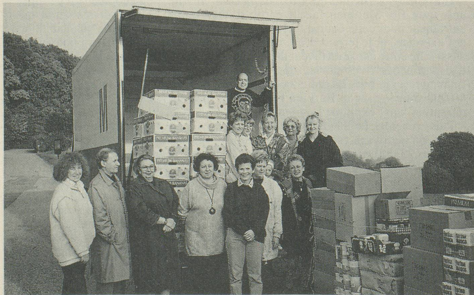
L'équipe neuchâteloise au travail.

C/o Laurent Borel, Guillaume-Farel 7, 2053 Cernier/NE Tél. 038/53 70 00 C.C.P. Banque cantonale Neuchâtel 20-136-4 en faveur de E. 123.729.17 Avec mention : Cartons du Cœur.