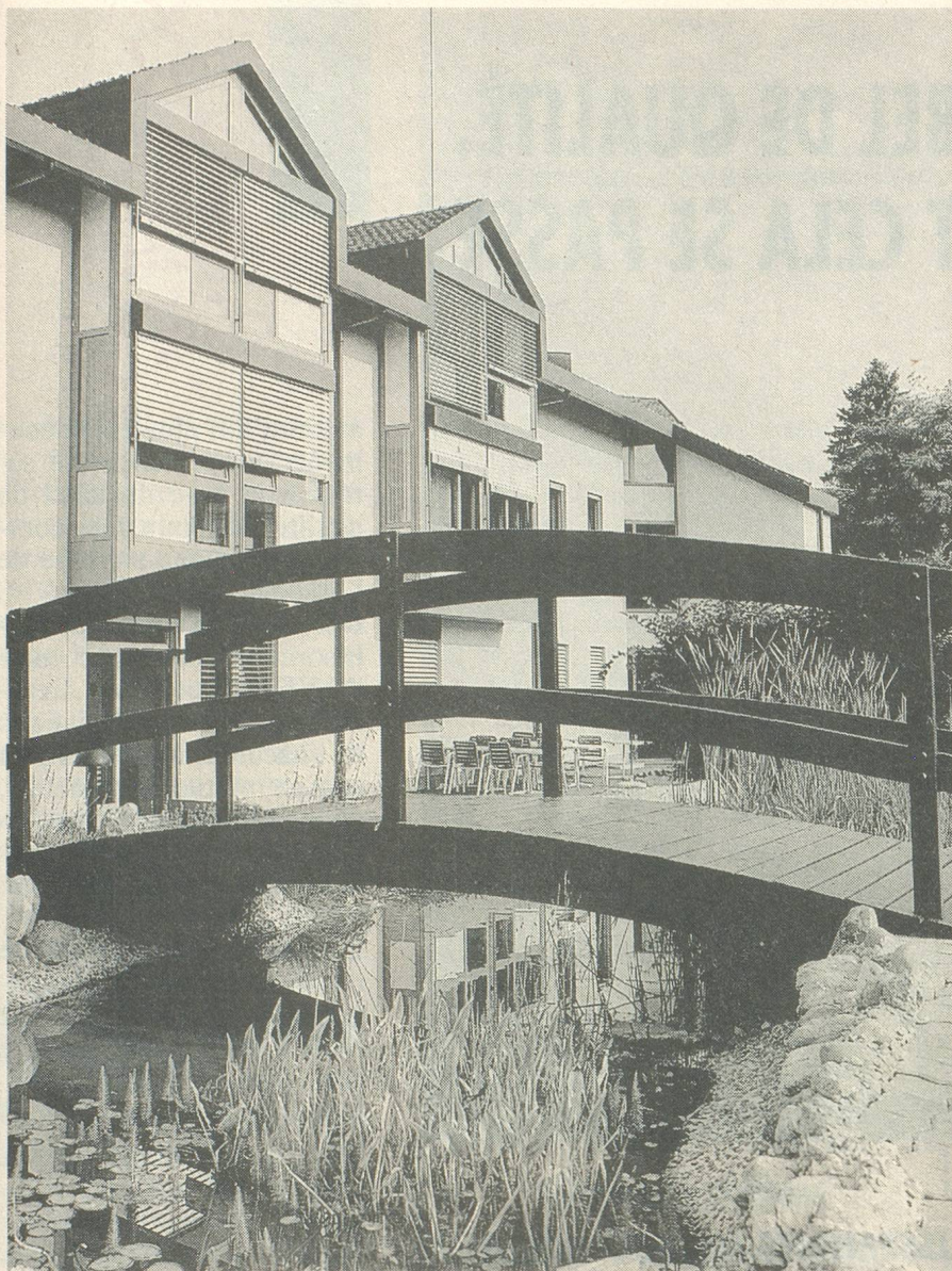
L'un des 150 membres de l'AVDEMS: l'EMS «La Faverge» à Oron-la-Ville.