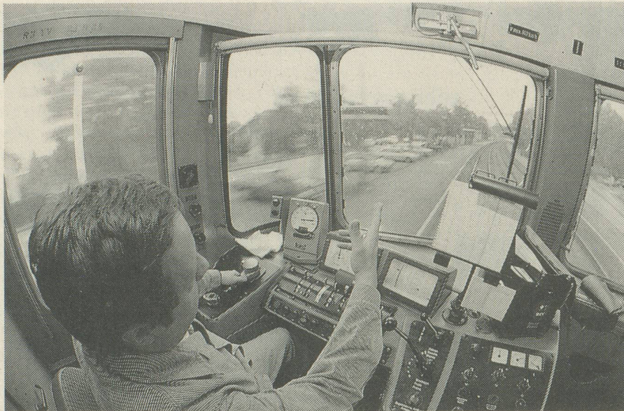
Le train pour un voyage rapide, sûr et confortable.

re inclus. Les prix pratiqués ne sont pas dissuasifs: à peine plus de mille francs pour une croisière de huit jours, pension et vol compris (au départ de Zurich).