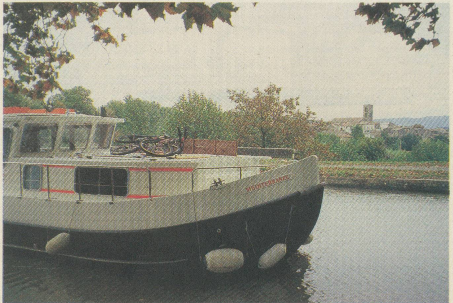
Capitaine d'une péniche au fil de l'eau...

Chaque année, les CFF proposent un certain nombre d'excursions accompagnées (renseignements dans toutes les gares de Suisse). En outre, les agences